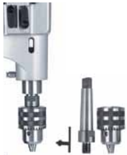
Адаптер з хвостовиком МКЗ та патрон до 16 мм (опція)