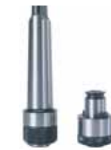
Адаптер з хвостовиком МКЗ та цанговий зажим для метчиків малих діаметрів