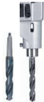
Хвостовик свердління свердлами МКЗ